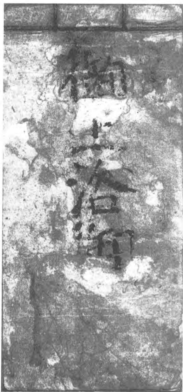
三 御上洛御用留 七・八 cm × 十六・五 cm ニツ目綴