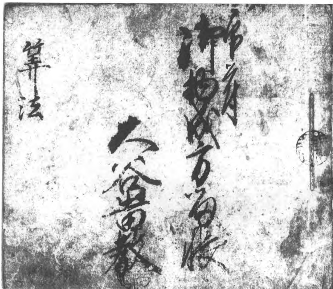
七 印符 御物成方留帳 十四cm×十六cm 二ツ目綴